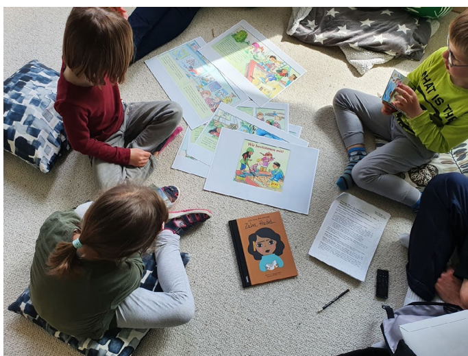
Abbildung 1: Erhebungssituation mit der Methode des Buchdialogs in Kita 1

Die Auswahlkriterien für die Kurzgeschichten waren der thematische Bezug zu den Forschungsfragen sowie altersgerechte und vorurteilsbewusste Bebilderungen und Erzählungen. Zur Veranschaulichung wurden die Bildgeschichten auf DIN-A3-Format vergrößert. Dabei wurden vom Forschungsthema wegführende Buchseiten ggf. ausgelassen.